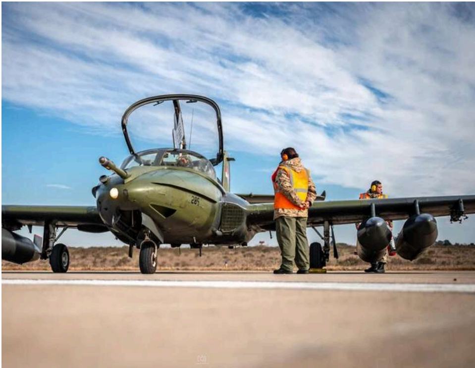
Пів століття в небі: Уругвай остаточно попрощався з легендарними реактивними штурмовиками A-37 Dragonfly

Завдяки закупівлі A-29 Super Tucano у Бразилії уругвайці змогли вивести з експлуатації до шести A-37B Dragonfly після майже пів століття служби.