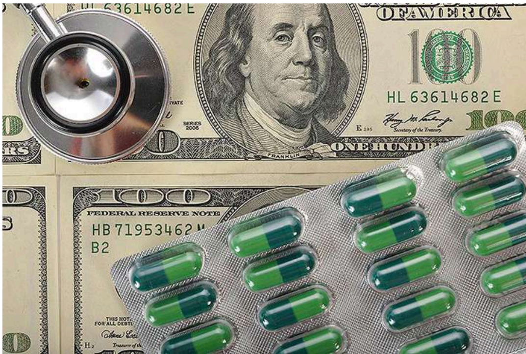
Фото: У світі активно підорбляють ліки

У світі спостерігається різке зростання випадків незаконного продажу протипаразитарних препаратів, повідомляє Інтерпол. Така тенденція востаннє була під час пандемії COVID-19, нагадує відомство.