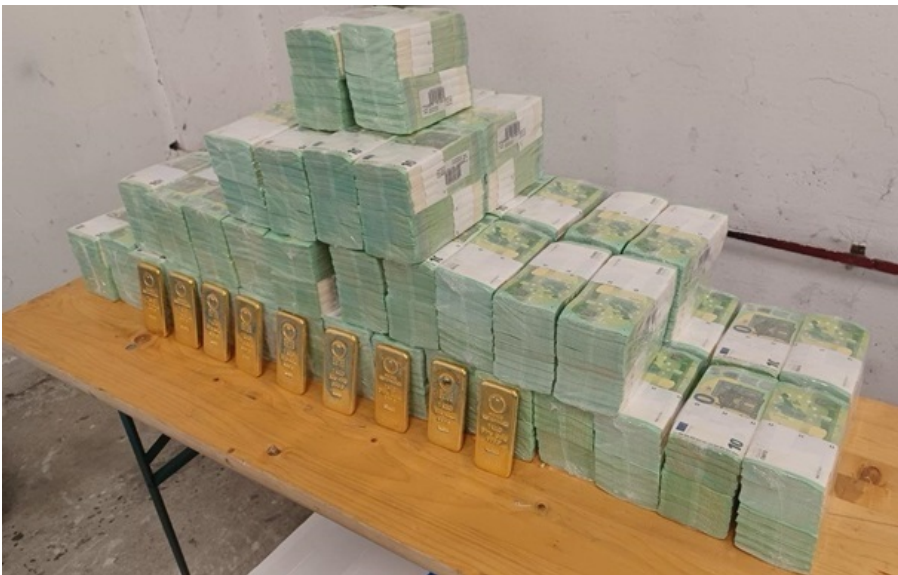
Гроші і золото, які були повернуті Ощадбанку