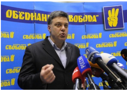
Свобода вважає необґрунтованими звинувачення її в антисемітизмі

Партія Всеукраїнське об'єднання Свобода вважає необґрунтованими звинувачення її в антисемітизмі.