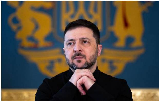
Фото: Володимир Зеленський (Getty Images)

Обирайте перевірене - додайте РБК-Україна до улюблених джерел у Google