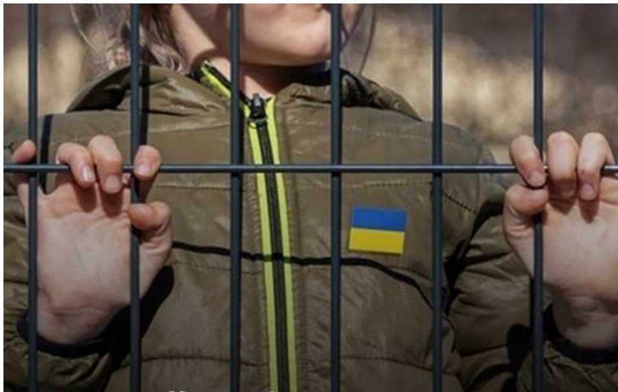
Україна нагадала Європі про викрадених Росією українських дітей

Кремль боїться теми викрадених українських дітей, розуміючи, що здійснює злочин за міжнародним правом.