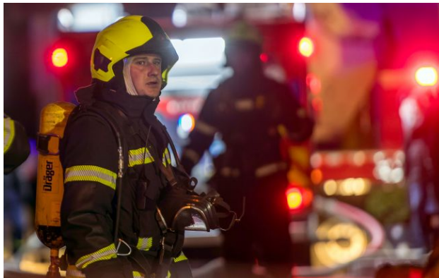
Фото: про наслідки атаки буде відомо пізніше (Getty Images)

Обирайте перевірене - додайте РБК-Україна до улюблених джерел у Google