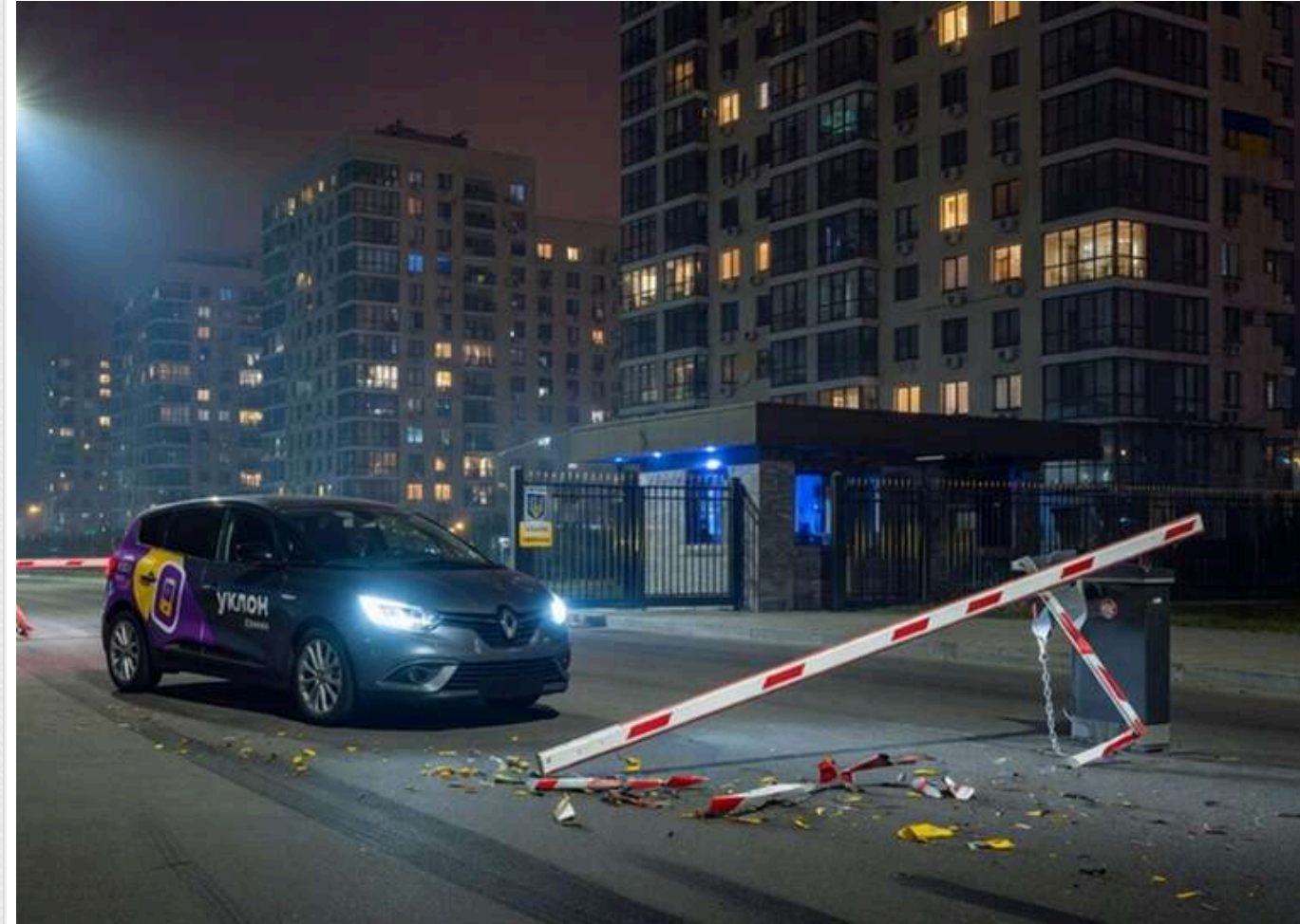
Таран за 50 тисяч: у Києві водій Uklon зніс шлагбаум ЖК, а сервіс відмовився блокувати порушника

Водій служби таксі Uklon зруйнував шлагбаум при в'їзді до київського житлового комплексу та поїхав, залишивши будинок фактично відкритим і мешканців - з пошкодженням вартістю до 50 тисяч гривень. Схожі скандали з таксистами трапляються у Києві регулярно - неадекватна поведінка водіїв служб перевезень стала системною проблемою столиці. Uklon через службу підтримки запропонував водію добровільно відшкодувати збитки, однак той відмовився, а сама компанія обмежилась обіцянкою "взяти питання на контроль". Будинок залишається без шлагбаума, кошти на ремонт - невідомо де брати, а водії досі перевозять пасажирів.