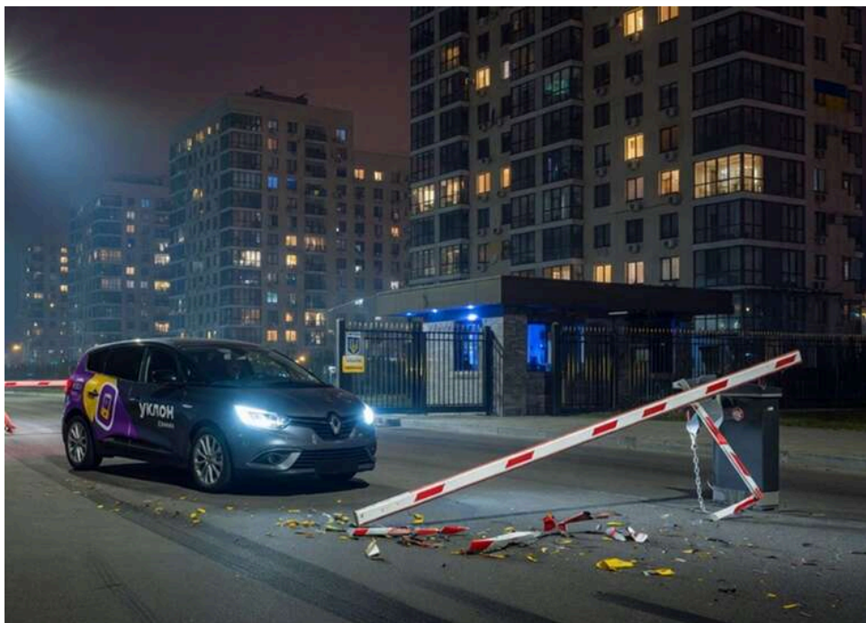
Таран за 50 тисяч: у Києві водій Uklon зніс шлагбаум ЖК, а сервіс відмовився блокувати порушника

Водій служби таксі Uklon зруйнував шлагбаум при в'їзді до київського житлового комплексу та поїхав, залишивши будинок фактично відкритим і мешканців - з пошкодженням вартістю до 50 тисяч гривень. Схожі скандали з таксистами трапляються у Києві регулярно - неадекватна поведінка водіїв служб перевезень стала системною проблемою столиці. Uklon через службу підтримки запропонував водію добровільно відшкодувати збитки, однак той відмовився, а сама компанія обмежилась обіцянкою "взяти питання на контроль". Будинок залишається без шлагбаума, кошти на ремонт - невідомо де брати, а водій досі перевозить пасажирів.