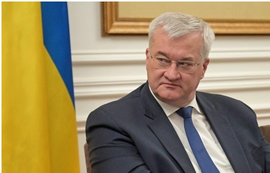
Міністр закордонних справ України Андрій Сибіга

Путін може мати стимул у припиненні атак на аеропорти, оскільки основні російські транспортні вузли, включаючи міжнародний аеропорт Шереметьєво та Пулково стають дедалі вразливішими до українських атак.