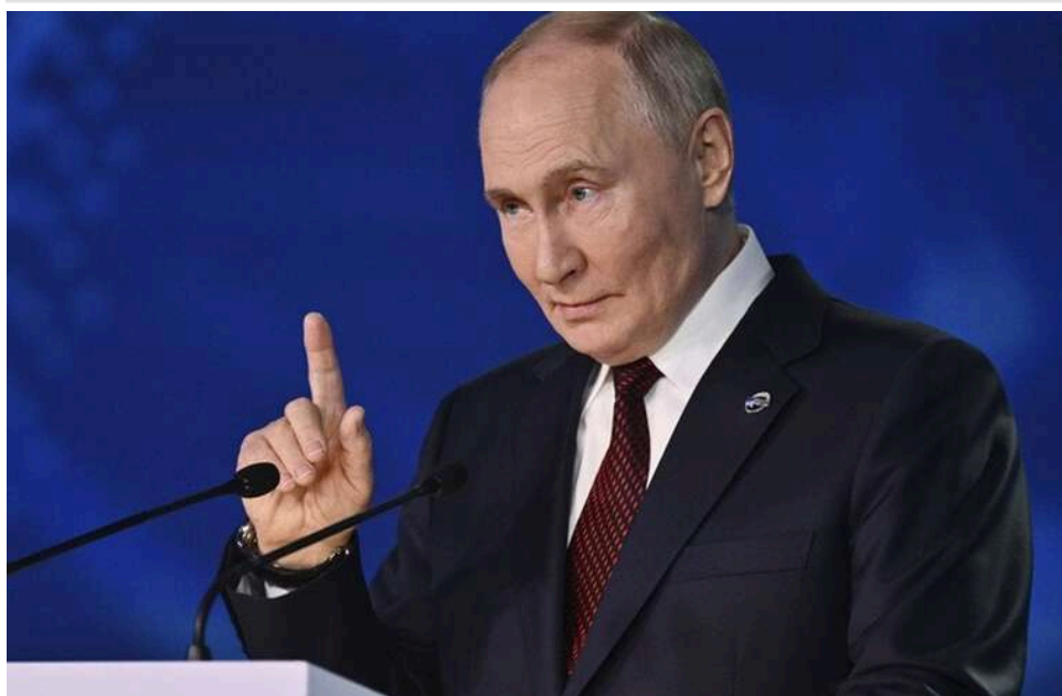
Гра на заспокоєння: чому заяви Путіна про "завершення війни" адресовані росіянам, а не Україні

Політичний оглядач Філіпп П'ятов прокоментував слова Володимира Путіна про те, що «справа йде до завершення» конфлікту в Україні. На його думку, подібні заяви можуть мати не стільки політико-дипломатичний, скільки внутрішньополітичний характер і бути адресованими насамперед російському суспільству.