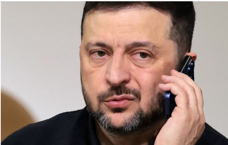
Чи відбудеться розмова Зеленського і Путіна?

Голова Офісу президента Кирило Буданов повідомив, що Україна готова до розмови президента України Володимира Зеленського з лідером Кремля Володимиром Путіним.