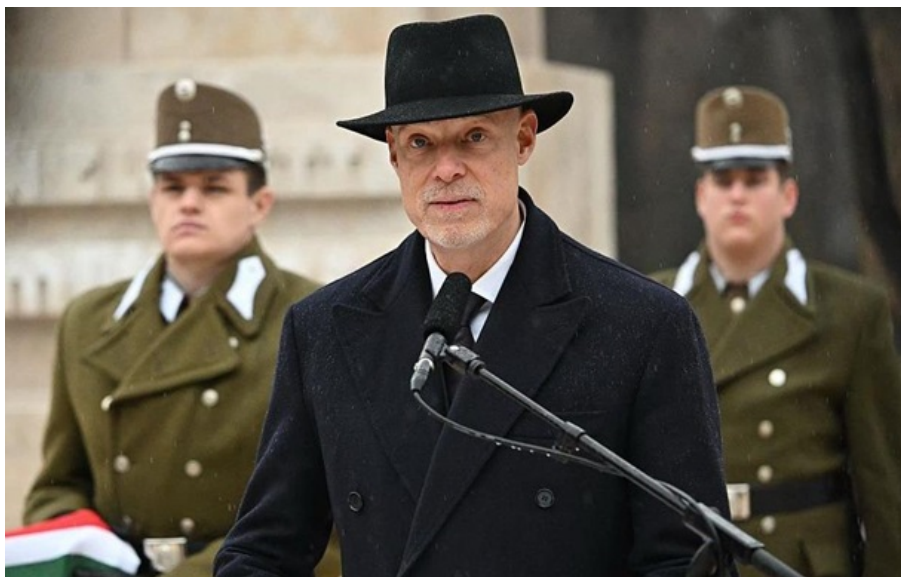
Міністр оборони Угорщини Кріштоф Салай-Бобровніцький