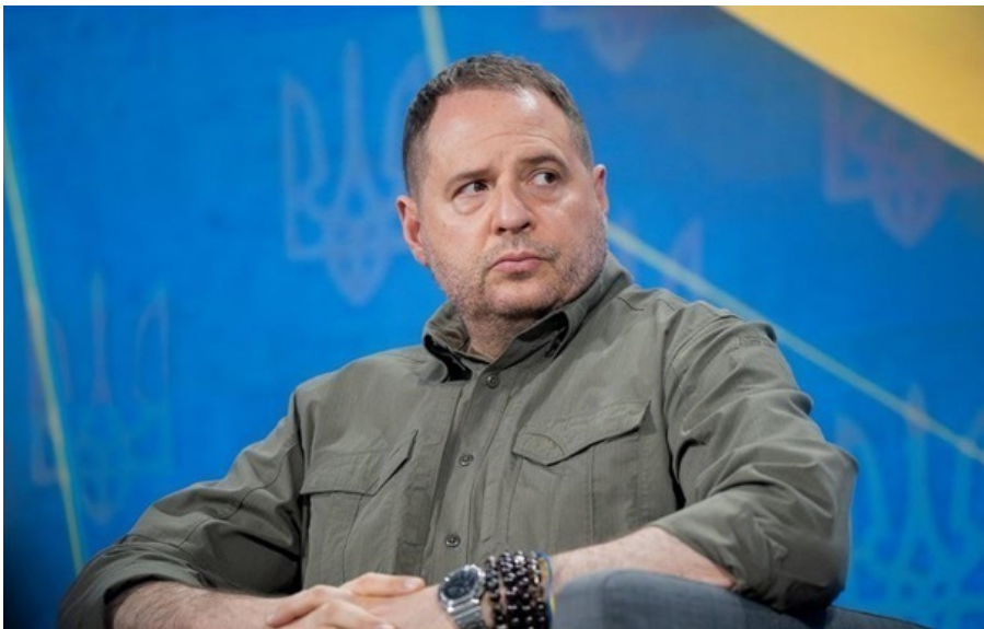
Єрмак отримав підозру через Династію

Екскерівник Офісу президента після оголошення підозри заперечив, що має будинок у кооперативі Династія.