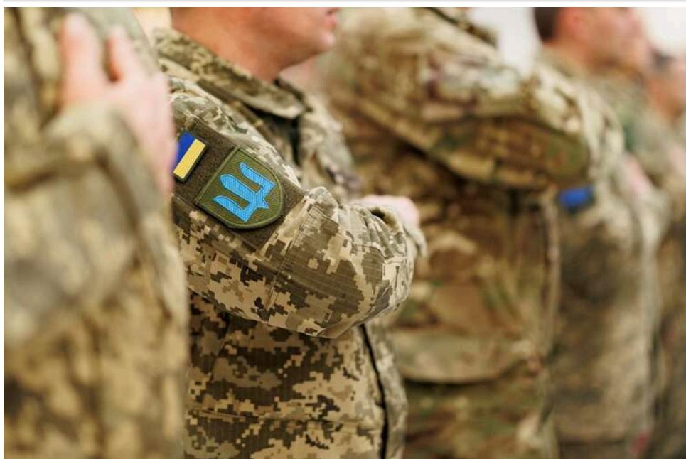
Шестеро на одного: у Харкові співробітники ТЦК силоміць затагли чоловіка в бус та били ногами

У Харкові шість співробітників ТЦК затагли чоловіка в мікроавтобус.