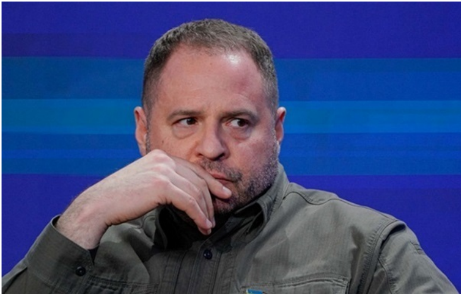
Андрію Єрмаку оголосили підозру

Справа стосується викриття угруповання, причетного до легалізації 460 млн гривень на елітному будівництві під Києвом.