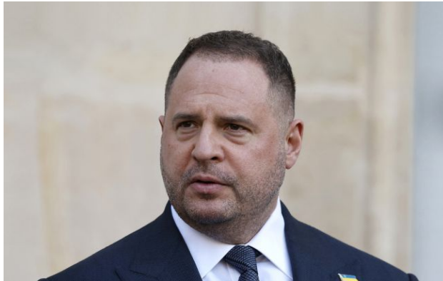
Фото: Андрій Єрмак, екс-керівник ОП

Обирайте перевірене - додайте РБК-Україна до улюблених джерел у Google