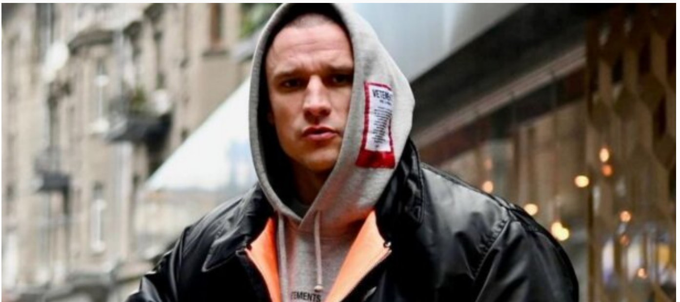
Фото Тараса Цимбалюка

Актор вступився за свого колегу, але впевнений, що знімати мильні опери сьогодні - це дно.