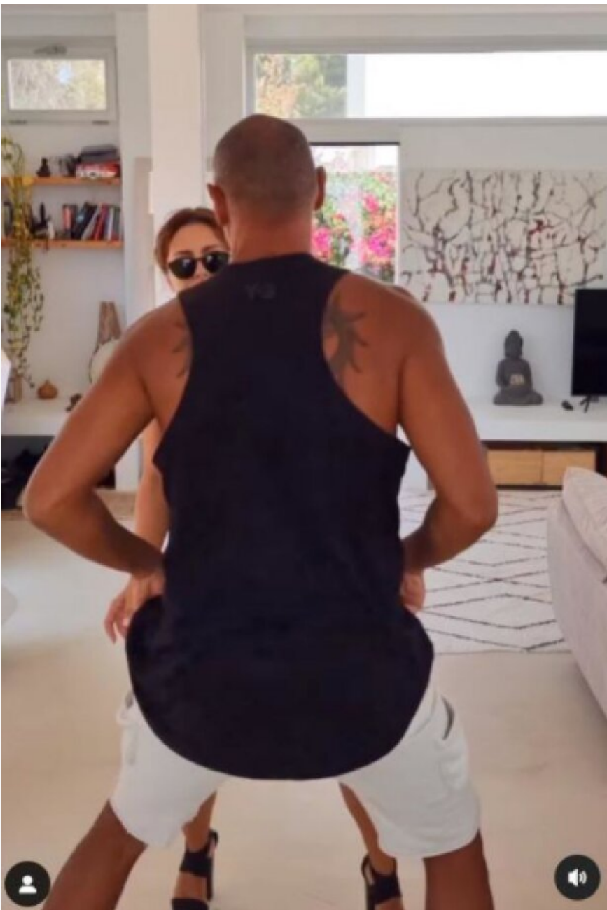
Скріншот публікації Ані Лорк

Крім того, Ані Лорак піддалася критиці за своє мовчання про війну між Росією та Україною, що продовжується, особливо після того, як вона вирішила жити і працювати в Росії, яка була залучена в повномасштабну війну проти її рідної країни. Деякі користувачі висловили своє несхвалення її рішення залишитися в Росії та явному небажання виступати проти війни на Батьківщині, особливо з урахуванням серйозності ситуації.