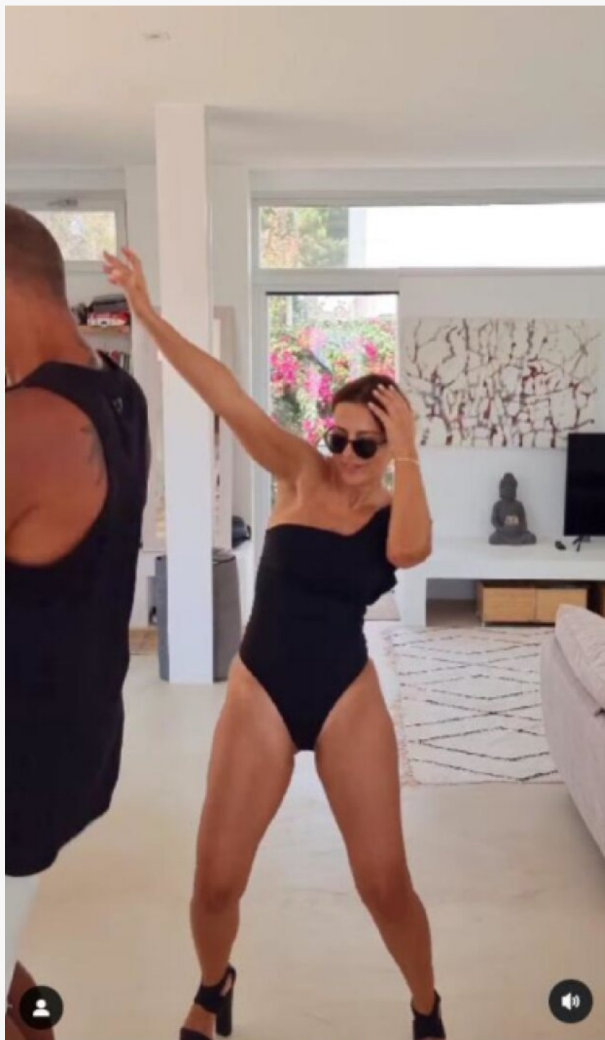
Скріншот публікації Ані Лорк