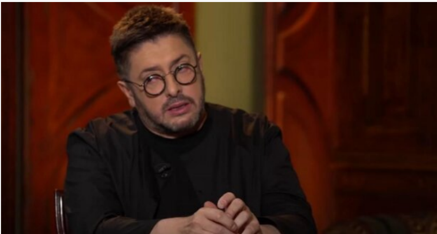
Олексій Суханов: скрін з відео

Відомий ведучий розповів про свою маму-росіянку