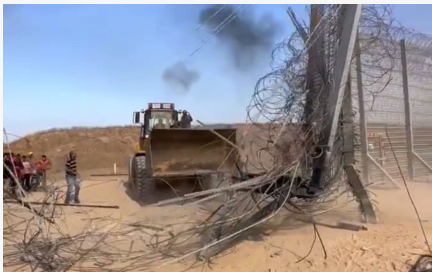
війна в Ізраїлі

В Ізраїлі, де розпочалося загострення з бойовиками ХАМАС, гинуть люди. Однак росіяни і тут відзначились своєю жорстокістю.