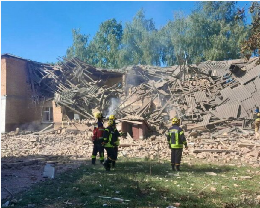
окупанти вдарили Шахедом по школі

Леон Панетта зауважив, що головна мета Путіна - підрив демократії в США і інших країнах.