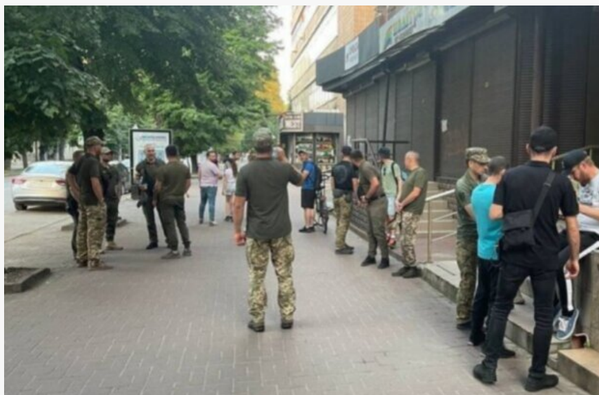
Працівники ТЦК: скрін з відео

Юнаки мають прибути для важливої процедури.