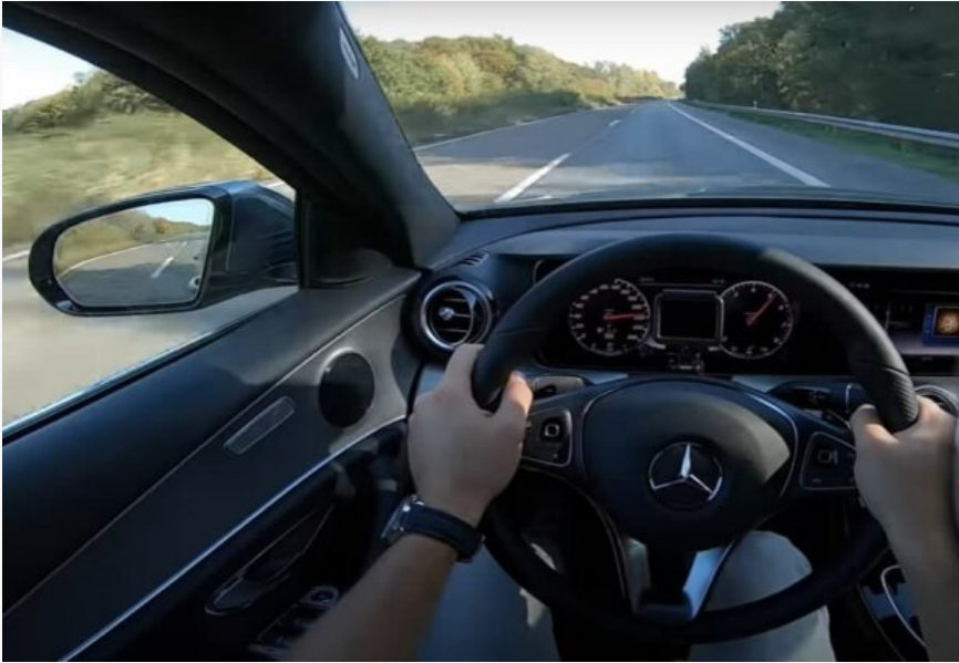
Водитель Mercedes, скриншот YouTube

Крім того, водії, які отримали численні штрафи, будуть зобов'язані скласти теоретичні та практичні іспити.