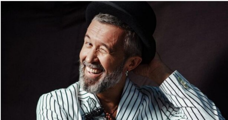
Фото Сергея Бабкіна