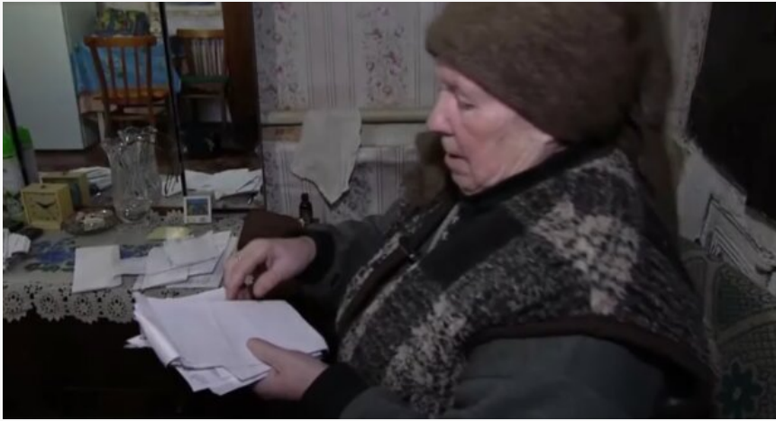
Субсидія в Україні

число місяця, з якого призначається житлова субсидія, Якщо хтось із членів домогосподарства або члена сім'ї володіє більш ніж одним транспортним засобом, що підлягає реєстрації, та з року випуску минуло менше 15 років (крім мопеда та причепа), субсидія не призначається.