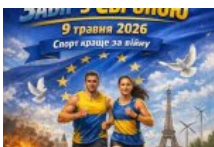
Кросівки замість слів: як на ВДНГ святкуватимуть День Європи з користю для фронту