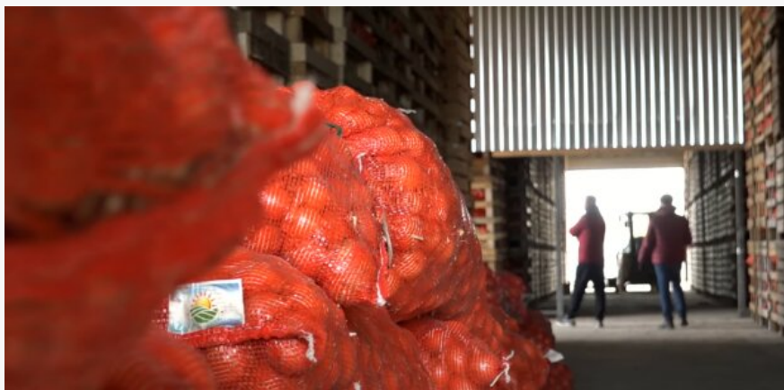
Цены на лук в Украине

як було минулого року", – пояснив експерт.