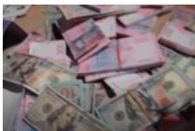
Перевитрати на мільйони: бюджетні кошти віддали на системи оповіщення, які не відповідають нормам законодавства