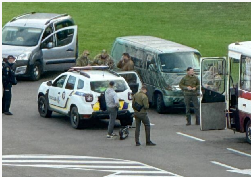
мобілізація в Україні