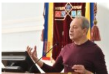
Микола Томенко: "Орденоносець путіна Ківалов відкриває університет у Лондоні під патронатом влади"