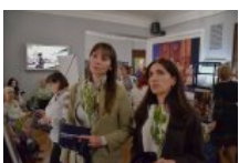
Біль, що застиг у зіницях: у Києві відкрили виставку про жінок, які живуть в очікуванні дива