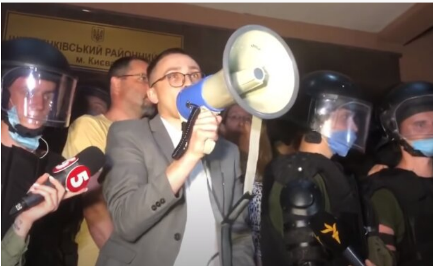
Сергей Стерненко: Скриншот YouTube

Посадовець, який ще нещодавно був блогером, а зараз став радником міністра оборони Сергій Стерненко опинився у центрі резонансного скандалу після публікації допису, в якому звинуватив військових 425-го штурмового полку «Скеля» у «злочинному ставленні до людей», використавши для цього відео з російських джерел.