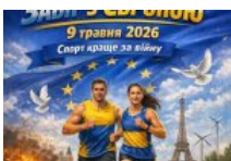
Кросівки замість слів: як на ВДНГ святкуватимуть День Європи з користю для фронту