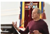
Микола Томенко: "Орденосець путіна Ківалов відкриває університет у Лондоні під патронатом влади"