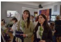
Біль, що застиг у зніцях: у Києві відкрили виставку про жінок, які живуть в очікуванні дива