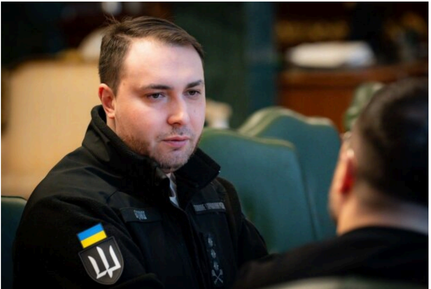
голова ОП Кирило Буданов

На тлі показового протесту депутатів під час голосування за податкові законопроекти та їх критики на адресу уряду та навіть ОП, голова ОП Кирило Буданов провів зустріч із керівництвом Ради та комітетів.