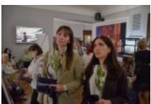
Біль, що застиг у зіницях: у Києві відкрили виставку про жінок, які живуть в очікуванні дива