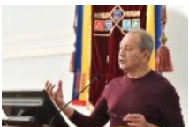
Микола Томенко: "Орденоносець"