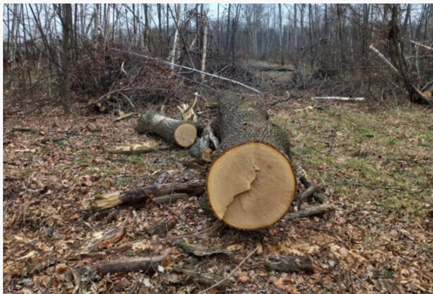
Незаконна порубка лісу на Житомирщині

Поки країна бореться за виживання, на Житомирщині розгорнулася справжня «лісова бійня».