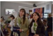
Біль, що застиг у зініцях: у Києві відкрили виставку про жінок, які живуть в очікуванні дива