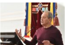
Микола Томенко: "Орденосець путіна Ківалов відкриває університет у Лондоні під патронатом влади"