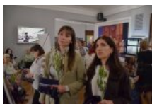
Біль, що застиг у зіницях: у Києві відкрили виставку про жінок, які живуть в очікуванні дива