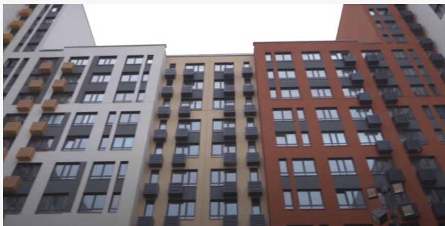
Новобудова: скрін з відео

Попри виклики війни, столична нерухомість продовжує демонструвати феноменальну стійкість