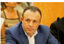
Дмитро Співак: США та Китай почали ділити світ — що в цих планах уготовано Україні