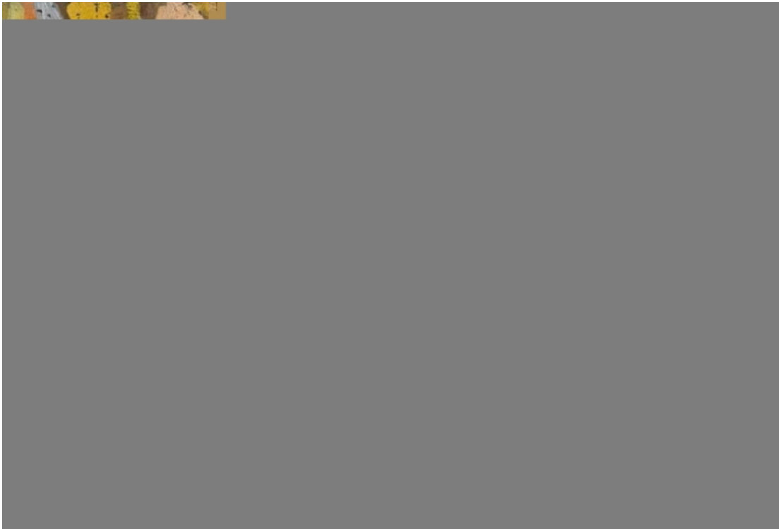
Робота художника Костюка Василя Васильовича «Єгипетські барви»

«Єгипетські барви» вирізняються своєю експресивністю та багатошаровістю. Полотно передає не лише естетичну красу, а й глибокий філософський зміст, що змушує глядача замислитися над зв'язком між культурами, історією та сучасністю. Мистецтвознавці, зокрема представники данських видань Kunst & Kultur і Art Today, назвали роботу Костюка однією з найвизначніших на виставці. «Картина вражає своєю здатністю поєднувати локальну ідентичність із універсальними темами, що робить її актуальною для світової аудиторії», – зазначила рецензія в Kunst & Kultur.