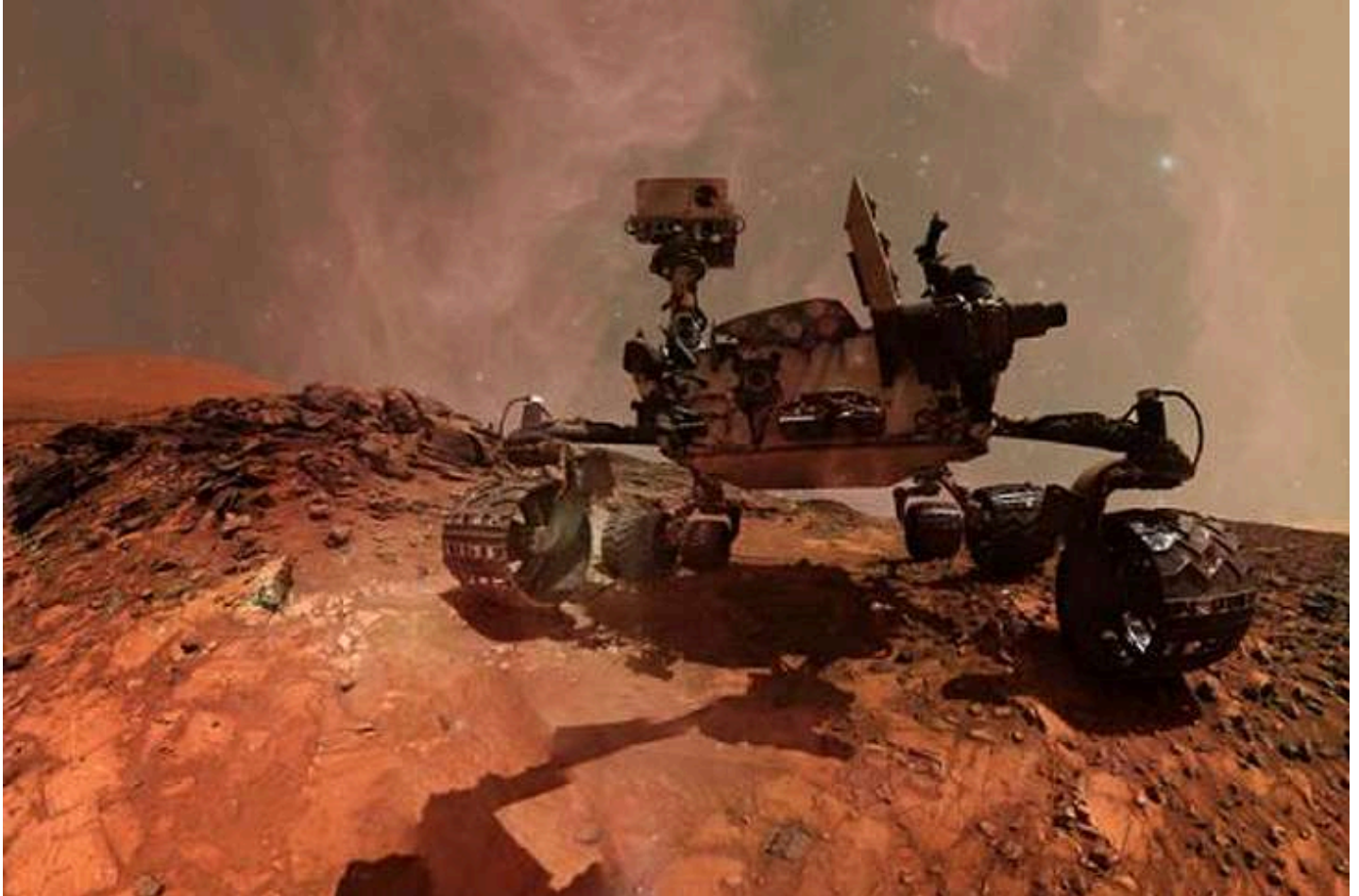
Марсохід Curiosity

Марсохід американської космічної агенції NASA Curiosity знайшов на планеті суміш органічних та хімічних речовин, зокрема 20 органічних сполук, схожих на "будівельні блоки життя". Про це повідомило видання Space.com .