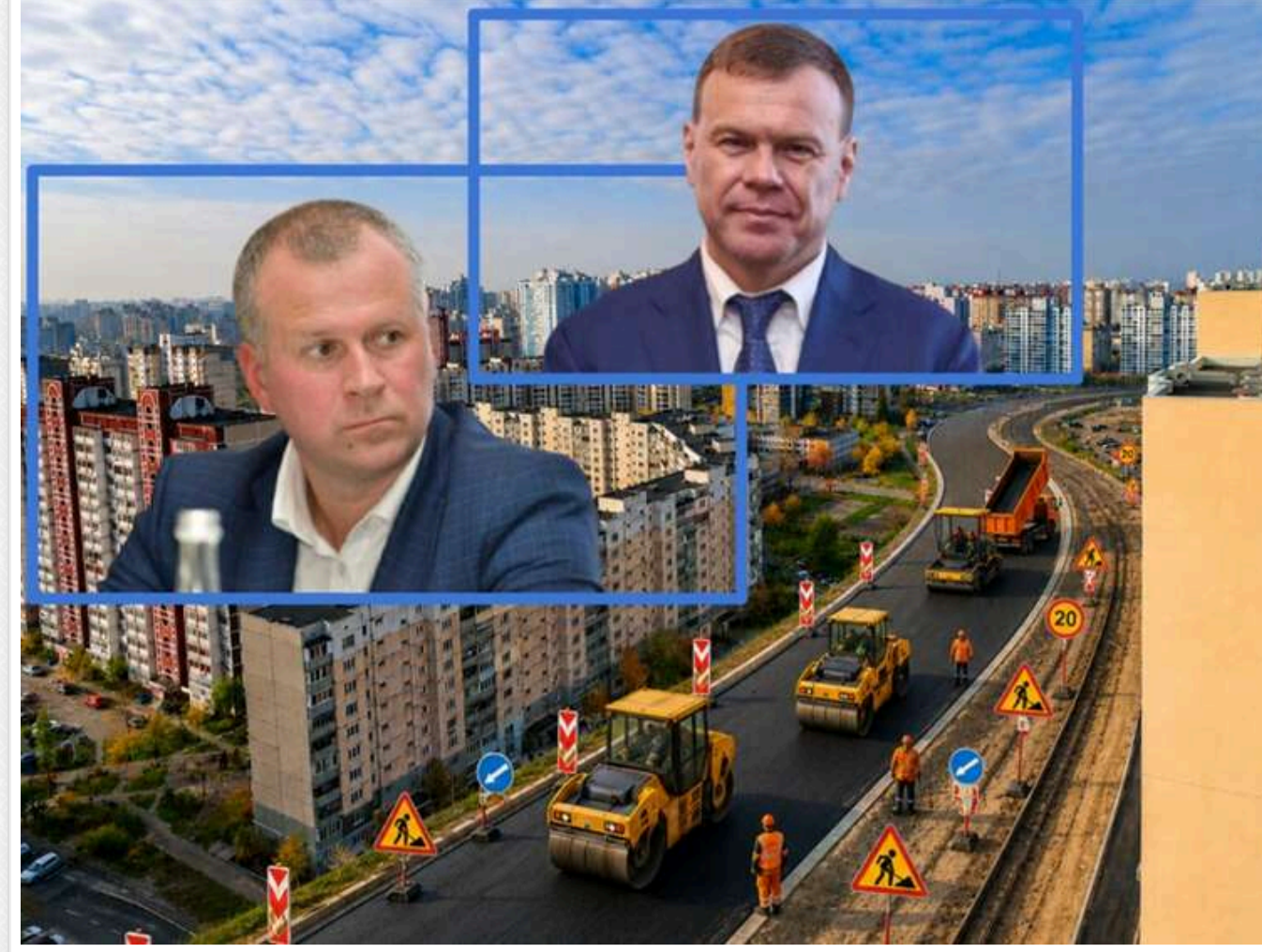
«Автомагістраль-Південь» отримала від Кличка ще пів мільярда: фірма з кримінальним минулим добудує вулицю на Троєщині

Столична корпорація «Київавтодор» замовила капітальне оновлення частини вулиці Милославської. П'ять років тому було відремонтовано відтинок між вулицями Радунської та Бальзака, тепер же роботи мають продовжитися до самої вулиці Закревського. Ідеться про 1,5 кілометра дороги, ремонт яких коштуюватиме місту понад 515 млн гривень.