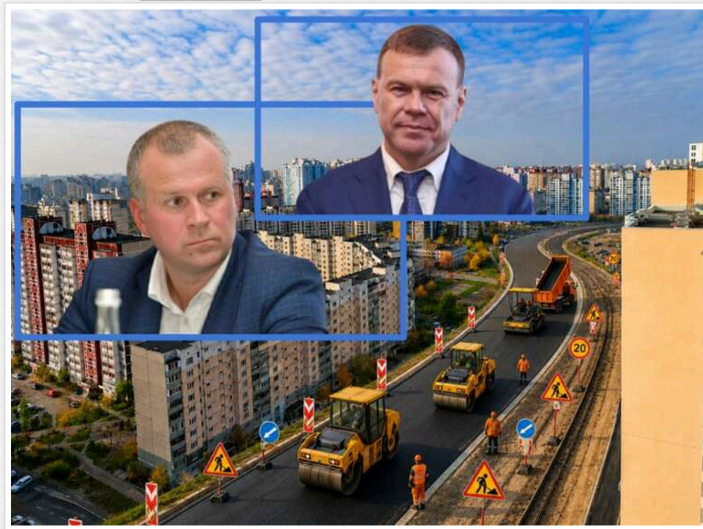
«Автомагістраль-Південь» отримала від Кличка ще пів мільярда: фірма з кримінальним минулим побудує вулицю на Троєщині

Столична корпорація «Київавтодор» замовила капітальне оновлення частини вулиці Милославської. П'ять років тому було відремонтовано відтинок між вулицями Радунської та Бальзака, тепер же роботи мають продовжитися до самої вулиці Закревського. Йдеться про 1,5 кілометра дороги, ремонт яких коштують місту понад 515 млн гривень. Виконуватиме роботи одеське ТОВ «Автомагістраль-Південь» — один із найбільших підрядників «Київавтодору» . Нещодавно компанія різко наростила статутний капітал — майже у сто разів, а її новим формальним власником стала австрійська фірма.