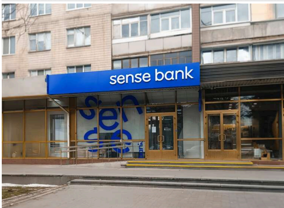
Брати Веселі та «Сенс Банк»: як родина дрогибицьких бізнесменів отримала контроль над конфіскованим майном РФ

Конфіскована у російських олігархів фінустанова мала стати «пральнею» для «відкатів» від гральної індустрії.