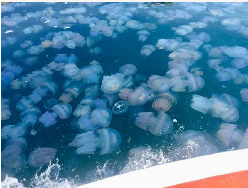
Медузи в Азовському морі

Одним із найнебезпечніших довгострокових процесів є зміна солоності Азовського моря. Через перекриття річкових стоків з боку Росії і загальне порушення водного балансу рівень солоності стрімко зростає.