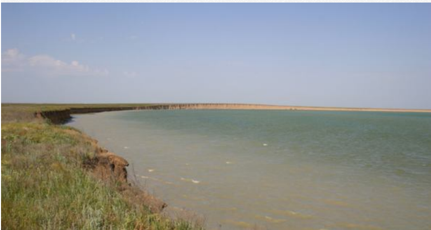
Берег одного з лиманів Сиваша

Сиваш, який є однією з найцінніших лагун Європи, також зазнає критичного впливу. Військові полігони на його берегах призводять до постійного потрапляння в воду боєприпасів та токсичних речовин.