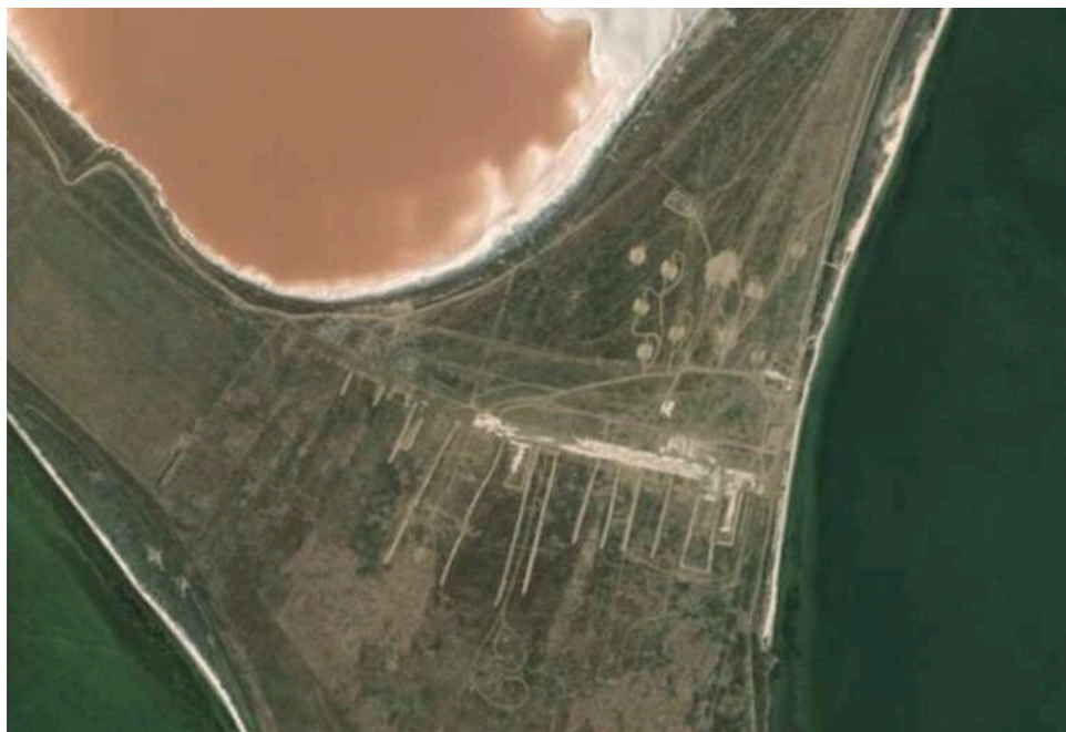
Екоцид на Арабатці: як російська окупація за три роки перетворила курортний край на зону екологічного лиха

Там, де раніше кричали чайки та відпочивали сотні тисяч українців, тепер панує запах гнилої нафти та адміністративний параліч. Російська окупація перетворила Арабатську Стрелку та Сиваш на "екологічну бомбу", де замість туристичної інфраструктури розростаються військові полігони та незаконні звалища.