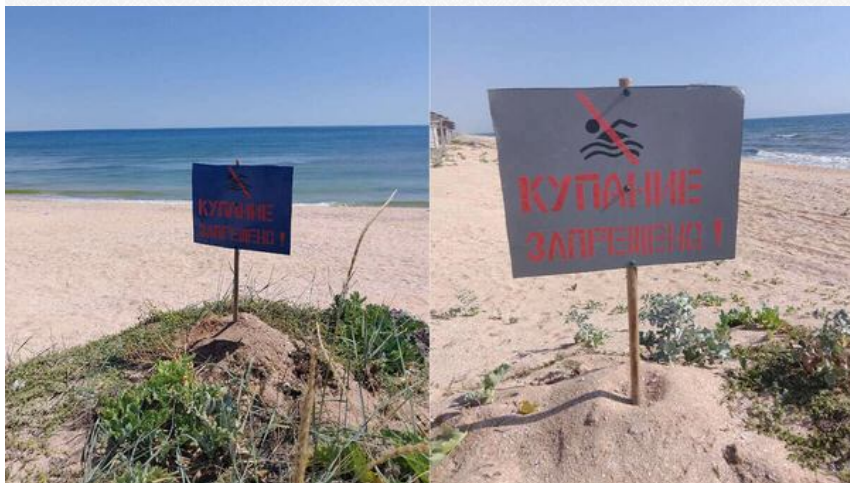
Таблички на Арабатській Стрілці

Це формує ефект «екологічної бомби уповільненої дії». Наслідки не завжди проявляються одразу, але з часом можуть призвести до масштабної деградації середовища, включно із забрудненням питної води. Перші наслідки почали проявлятися вже у перший рік окупації, коли окупаційна влада визнала перевищення небезпечних речовин у водах Азовського моря, що призводять до кишкових інфекцій та холери і почала забороняти купання в морі. Такі заборони почали з'являтися щороку і набули вже систематичного характеру.