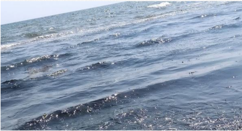
Нафтова пляма на березі с. Стрілкове

Окрему загрозу становлять розливи нафтопродуктів у районі Керченської протоки. Нафтові плями вже досягали значних ділянок узбережжя Арабатської Стрілки, створюючи довготривалі ризики для екосистеми.