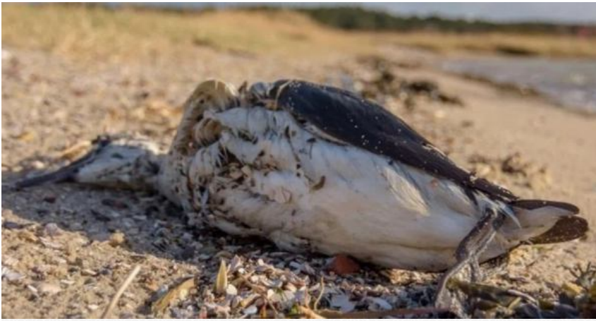
Мертвий птах на березі одного з лиманів Сиваша

Окрему загрозу становлять розливи нафтопродуктів у районі Керченської протоки. Нафтові плями вже досягали значних ділянок узбережжя Арабатської Стрілки, створюючи довготривалі ризики для екосистеми.