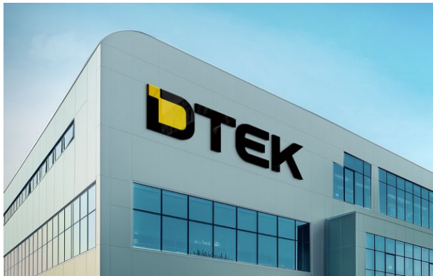
ДТЕК очолив рейтинг найбільших приватних інвесторів за час війни (dtek.com)

Група ДТЕК бізнесмена Ріната Ахметова попри руйнування і втрату активів, посіла перше місце у національному рейтингу найбільших приватних інвесторів в економіку України з початку повномасштабного вторгнення.