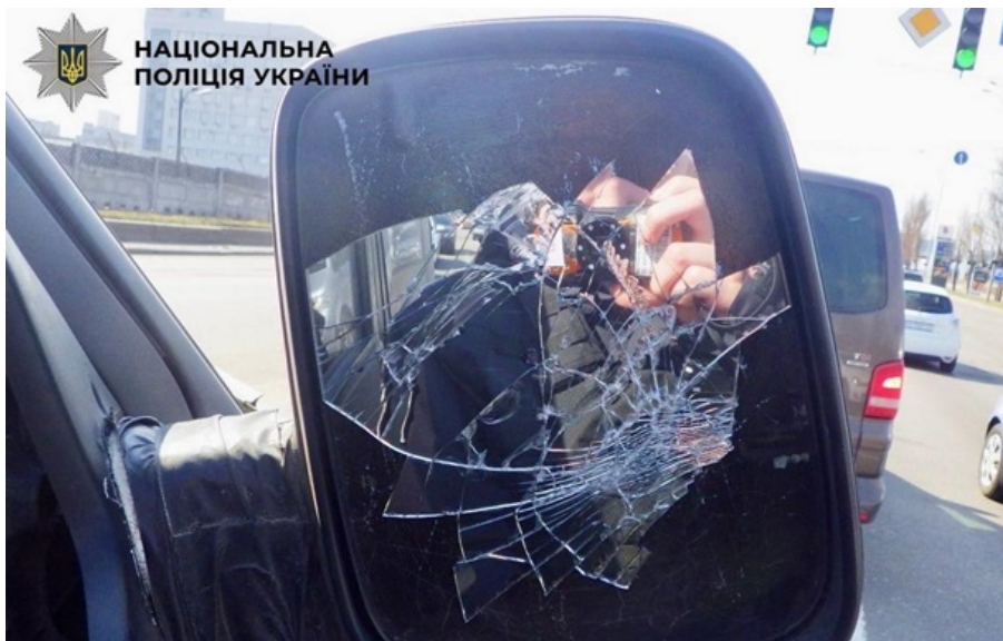
Злоумышленник разбил зеркало в автомобиле военнослужащего

Пассажир BMW вышел из машины и кулаком разбил зеркало легкового автомобиля. Затем он открыл дверь автомобиля и забрал у мужчины мобильный телефон.