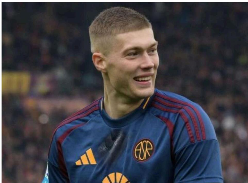
Артем Довбик може змінити Рим на Мілан: Аллегрі особисто зацікавлений у трансфері українця

Нападник збірної України Артем Довбик може продовжити виступи в чемпіонаті Італії. 28-річного уродженця Черкас було виставлено на трансфер римською "Ромою" після другого сезону у складі у "вовків", проте викликає величезний інтерес у багатьох європейських клубів.