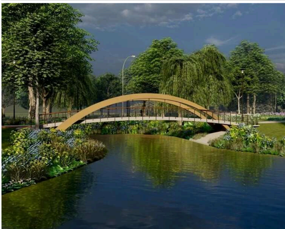
Міст за рахунок киян: Литва виділила 600 тисяч євро, а Київ додасть ще 111 мільйонів на новий об'єкт на Оболоні

Київська влада подає будівництво "Мосту Дружби" в парку на Оболоні як міжнародний жест підтримки від Литви.